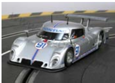
Riley Matthews Motorsport 24H Daytona 2008