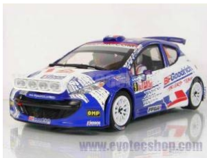
Peugeot 207 S2000