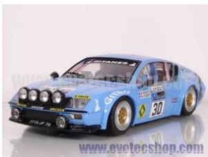
Alpine A 310