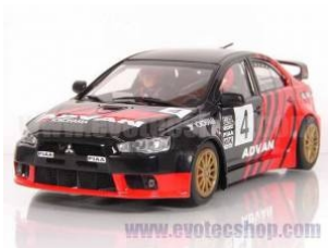
Mitsubishi Evo X